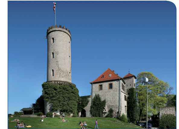
Die Sparrenburg, Bielefeld